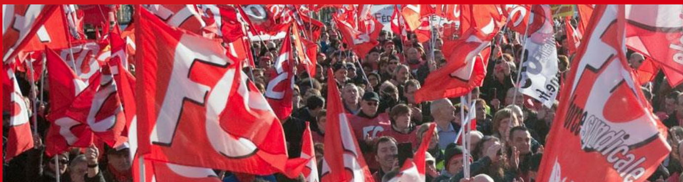
Manifestation des fonctionnaires le 22 mai 2018 à l'appel des 3 grandes organisations syndicales.